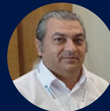
Lisani Deniz Denizler Bilişim Hizmetleri LTD.