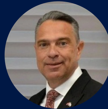
Mesut Ener DDEDK Başkanı